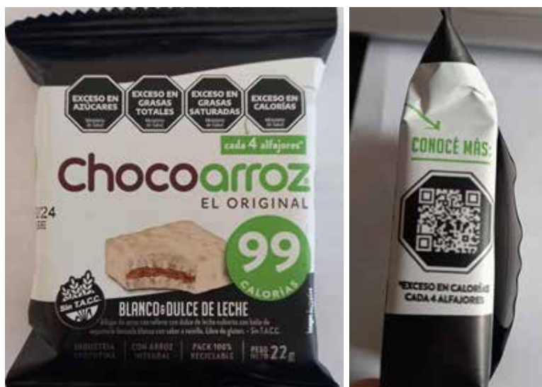
Figura 3. Presencia de publicidad dirigida a NNyA