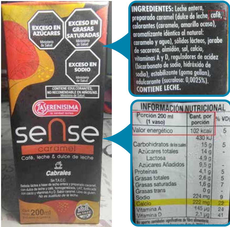
Figura 7. Presencia de claims.

según la información nutricional (más de 25 kcal/100ml), pero no se observa la colocación del sello correspondiente en la cara principal del envase.