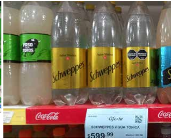
Figura 2. Incumplimientos de promociones