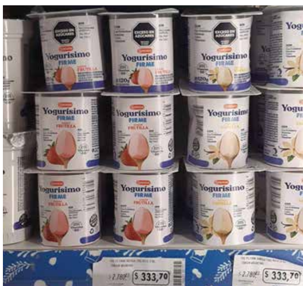
Figura 1. Incumplimientos de disposición en góndola